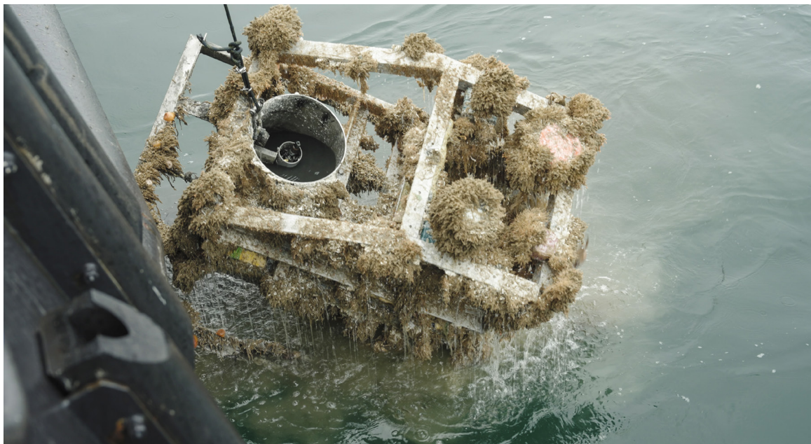
Équipement acoustique récupéré avec l'équipe acoustique de VLIZ, Mer du Nord, 2024

4 euros par personne, réservation obligatoire.