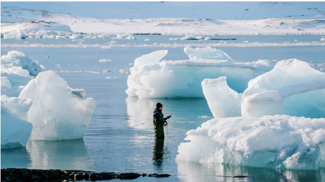
Elise Guillaume enregistre les sons de la fonte des glaces des glaciers dans l'Arctique à l'aide d'un hydrophone, Svalbard, 2023.

Plus d'informations sur : www.eliseguillaumeart.com/